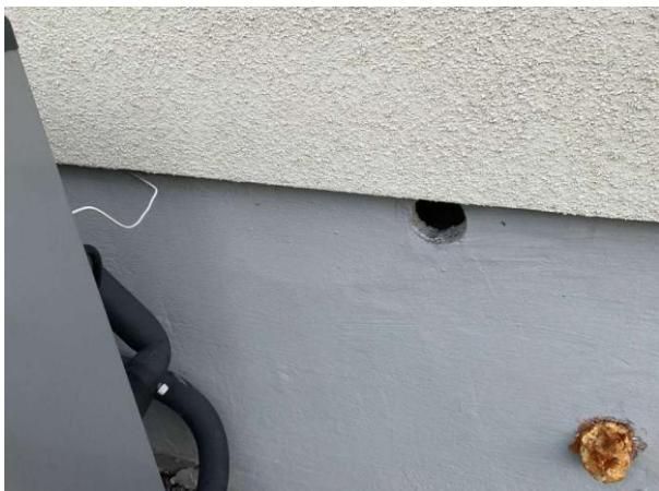
Bild 1: - Utvändigt, Grundmur/Hussockel, Hål noteras på grundmur...