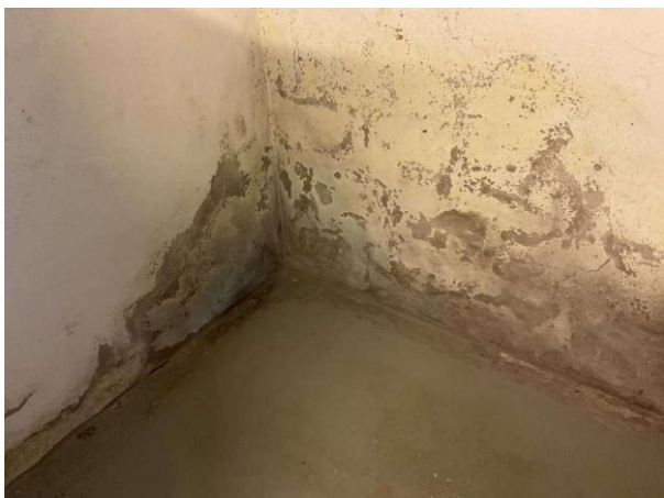
Bild 5: - Invändigt, Källarplan, Färgsläpp sprickor noteras på källaryttvägg