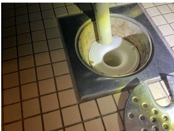
Bild 6: - Invändigt, Entréplan, Sättbruk döljer anslutande tätskikt Klämring saknas i golvbrunn