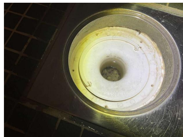
Bild 7: - Invändigt, Överväning, Sättbruk döljer anslutande tätskikt Klämring saknas i golvbrunn