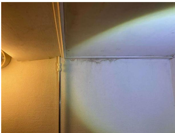
Bild 4: - Invändigt, Källarplan, Äldre standard Missfärgning noteras på innertaket/vägg