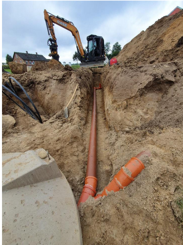
Anslutning mot befintlig avloppsledning i keramik