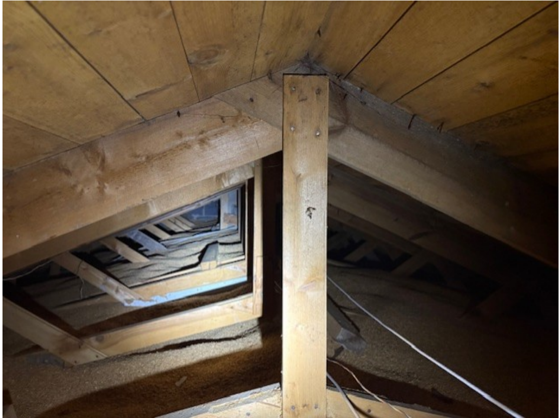
Nockvind gällande ursprunglig del.