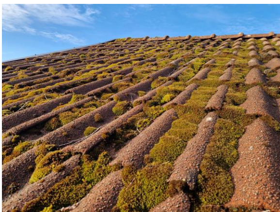
Mossa på takpannorna

I denna bilaga visas ett urval av de foton som tagits vid besiktningstillfället.