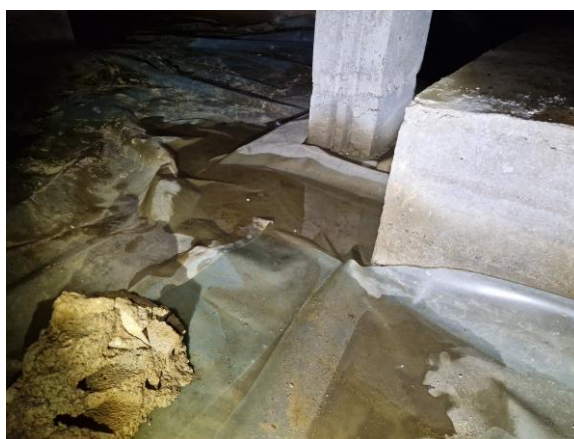
Visar klarvatten på plasten i krypgrunden.