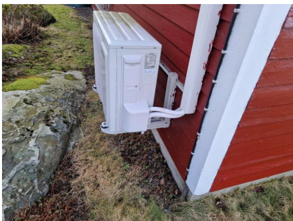
Kondensvatten leds inte bort från luftvärmepumpens utedel.