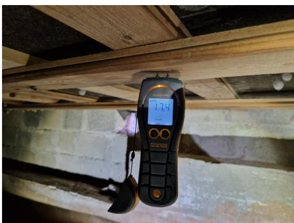
Krypgrund, visar förhöjda fuktkvotvärden >17%