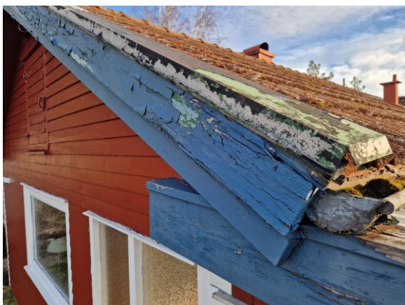
Rötskador på vindskivor