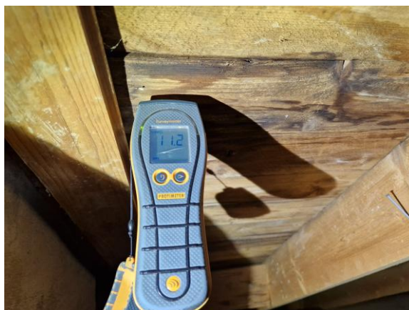
Visar fuktfläckar på vind, Inga förhöjda fuktkvotvärden vid besiktning.