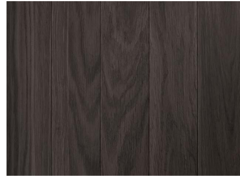
Snickerier, Mörkbetsad Ek