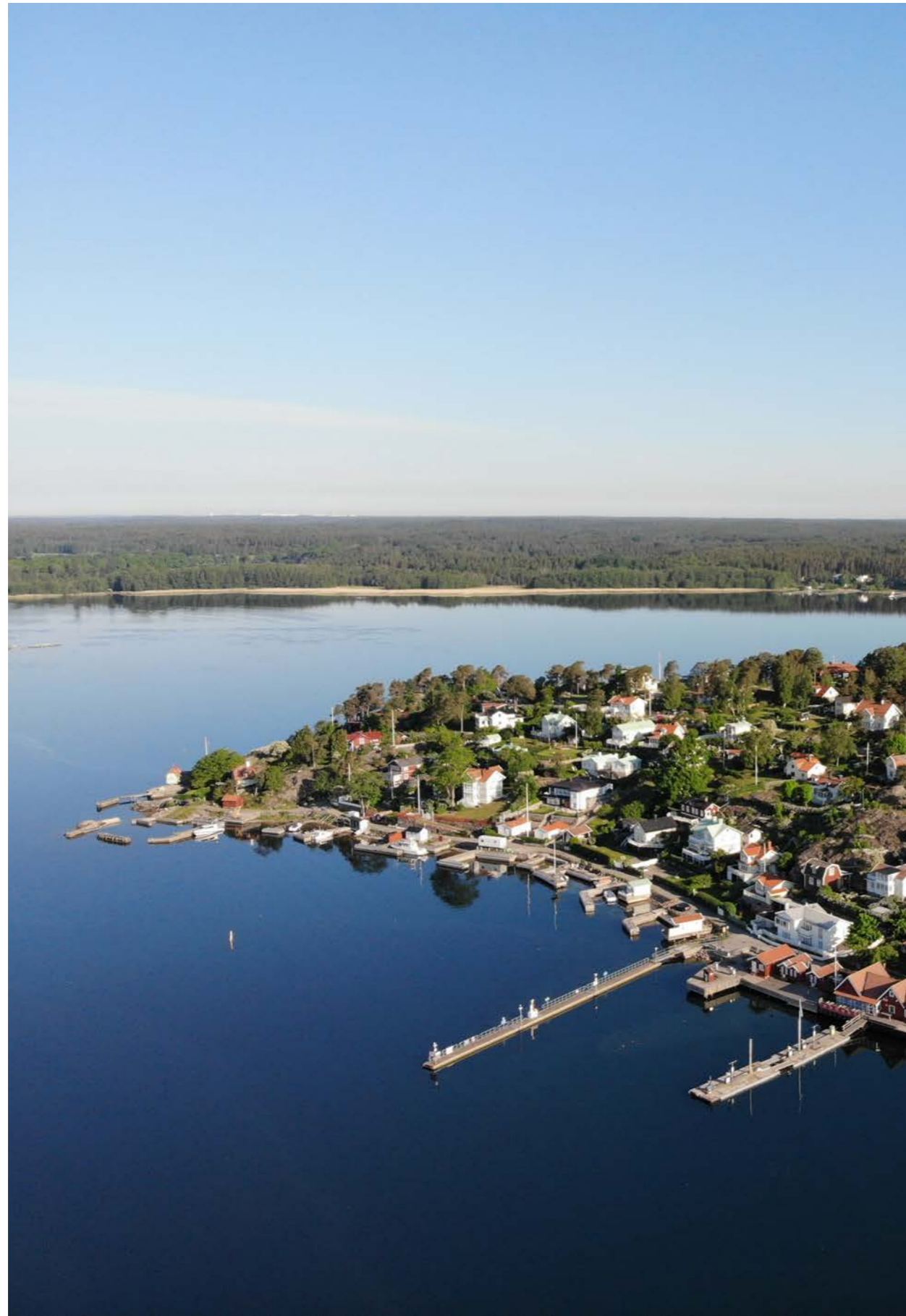
SÖDRA UDDEN Vy över Dalarö @imolabostad

Dalarös södra udde. Precis till höger om hamnbodarna och sjömacken kommer det nya kvarteret att ligga.