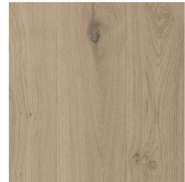
Timberwise, Sky White