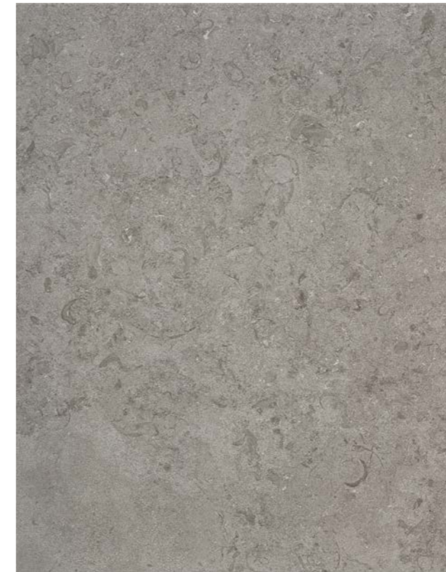
Bricmate, Norrvange Grey

Khakigröna luckor: Varmvita vägghälsor och tak. Inslä av fönster, innerdörrar och lister mälas i en ljus varmgrä kulört. Ekgolven har en lätt vitpigmentering. Över köksbänken kan du välja om du vill ha panel eller kakel.