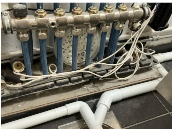
Bild 5: - Invändigt, Entréplan, Tät tröskel saknas Klämningens anslutning mot golvbrunn är dold av sättbruk Sk bomgolv noterades ...