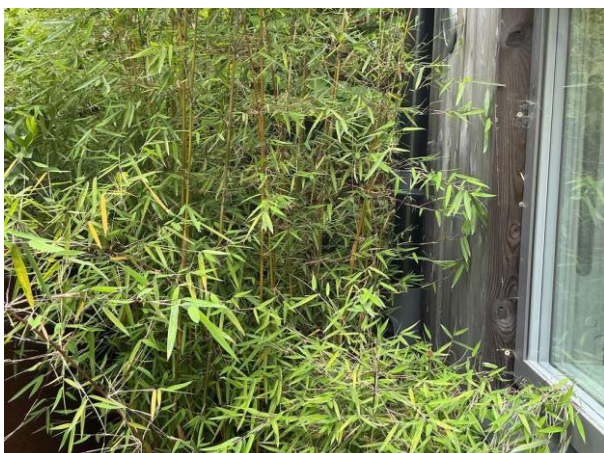
Bild 3: - Utvändigt, Fasad, Frånluftsdon är löst på fasaden på baksidan Del av fasad är dold av växter (ej besiktat) Enstaka ...