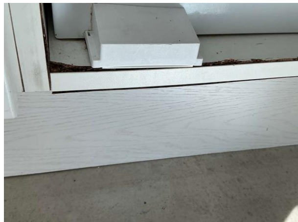
Bild 10: Invändigt, Övervakning, Tät botten i diskbänkskåpen saknas, regler för modern köksmiljö rekommenderar att botten i diskbä...