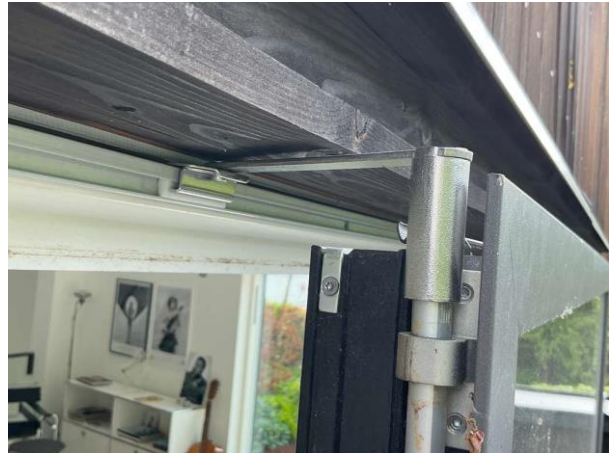
Bild 8: Invändigt, Övervakning, Nedböjning ovan glasparti noterades (det finns konstruktions-dokument och intyg KA att det är åtg...