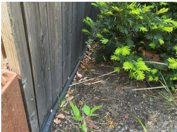
Bild 1: - Utvändigt, Mark, Fasadpanel är marknära monterad vilket kan leda till fuktuppsugning i ändträ på panelen Marken lu...