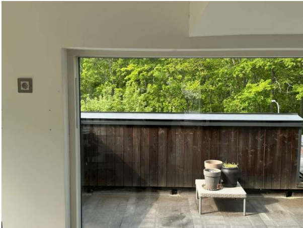
Bild 7: Invändigt, Övervakning, Nedböjning ovan glasparti noterades (det finns konstruktions-dokument och intyg KA att det är åtg...