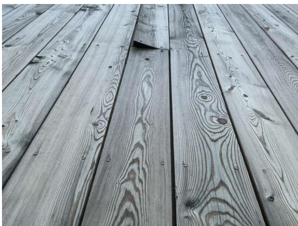
Bild 4: - Utvändigt, Fasad, Frånluftsdon är löst på fasaden på baksidan Del av fasad är dold av växter (ej besiktat) Enstaka ...