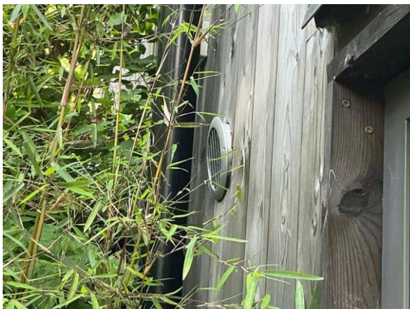
Bild 2: - Utvändigt, Fasad, Frånluftsdon är löst på fasaden på baksidan Del av fasad är dold av växter (ej besiktat) Enstaka ...