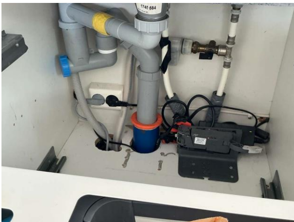
Bild 9: Invändigt, Övervakning, Tät botten i diskbänkskåpen saknas, regler för modern köksmiljö rekommenderar att botten i diskbä...